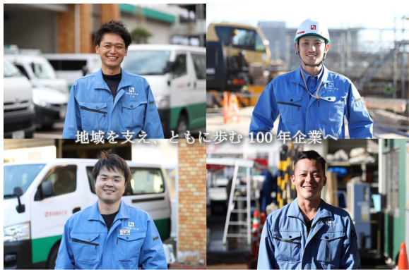
地域を支え、ともに歩む100年企業へ